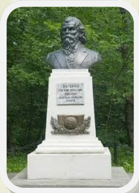
Памятник, возведенный в Г.Н. Потанину на его могиле в 1958 году после перенесения могилы Григория Николаевича в Университетскую рощу Томского государственного университета.

Потаниным и обнародовано географическим обществом в четырёхтомных «Очерках северо-западной Монголии», вышедших в 1883 году. В третьей экспедиции в китайскую провинцию Ганьсу он был изучал восточные окраины Тибета. Богатейший материал, собранный трудами членов экспедиции, помещён в разных специальных журналах, главным образом в издании географического общества: «Тангутско-тибетская окраина Китая и центральная Монголия».