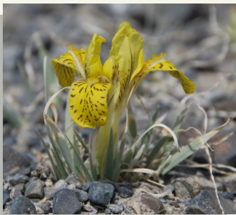
Растение Iris potaninii , названное в честь Григория Николаевича Потанина.