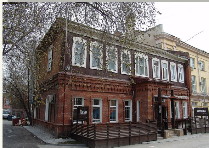
Двухэтажный особняк по улице Потанинская, дом 10/а. Жилой дом построен в 1915 г. Дом признан памятником архитектуры регионального значения.