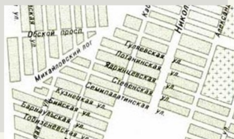
Карта Ново-Николаевска. 1906г.